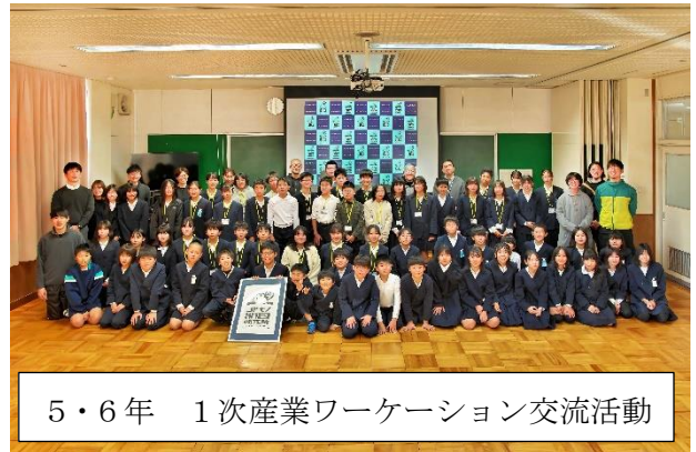
5・6年 1次産業ワークショップ交流活動

災害等から身を守るためには、訓練や学習も当然必要なことですが、その上で、毎日の生活の中に定着しているこうした集団生活上のよき習慣や互いの信頼関係を大切にしながら、子どもたちの生命・安全をしっかりと守り続けていきたいと思ひます。