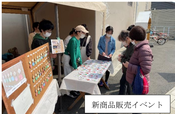
新商品販売イベント

しかし、実際の成長の仕方はそうではなく、階段のような成長線を描いているように思います。例えば、縄跳びや器械運動。初めて挑戦した時には、何もできないことが多く、練習をすることになります。最初は、いつまで経ってもできる気配がなく、練習を続けても上達したかどうかの実感さえない日が続きます。ところが、「諦めようかな」と考えた頃に、