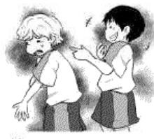
友だちをからかう