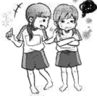
友だちに結果をしつこく聞く