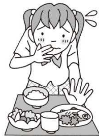
しょくよく 食欲がない