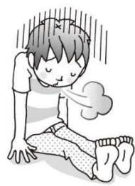
きで やる気が出ない