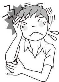
あたま 頭がいたい