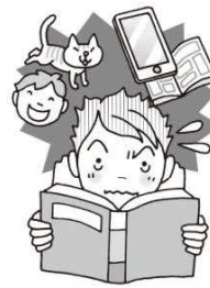
しゅうちゅう 集中できない