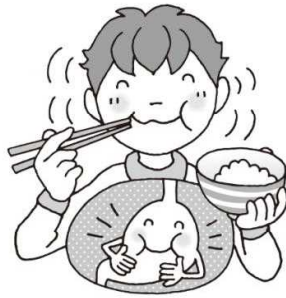
しょうか たす 消化が助けられ、 い ちやう はたら 胃腸の働きがよくなる