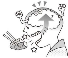
のう はつたつ 脳が発達する にん ちしやう よ ぼう 認知症の予防になる