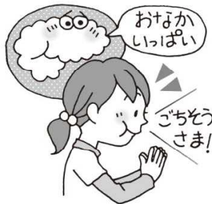
た ぶせ 食べすぎを防ぐので、 ひ まんぼうし 肥満防止になる