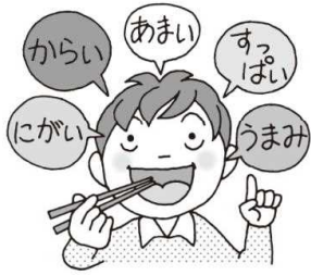
あじ 味がよくわかる

よくかんで食べることは健康なからだづくりにとても役立ちます。ひと口 30 回を目標に、じっくりよくかむ習慣を身につけましょう。