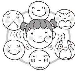
ひょうじょう 表情がゆたかになる