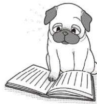
好きなことをする