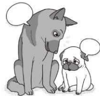
だれかに はなし を聞いてもらう