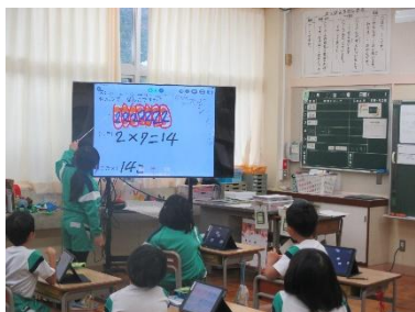
【タブレットを活用した授業】