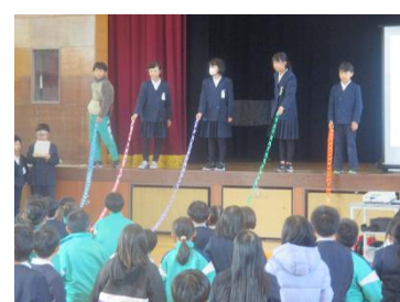
【人権集会 虹の輪づくり】

○明るく元気な子…①自分の健康を自分で守るために必要なことを理解し、自分で考えた生活習慣を実践していこうという意識を高める取り組みを行いました。