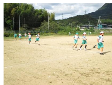
【チャレンジマラソン】