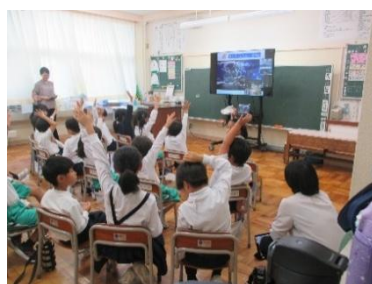
【美ら海水族館オンライン授業】