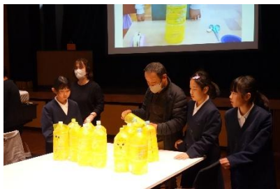
カラスよけを一つプレゼントです