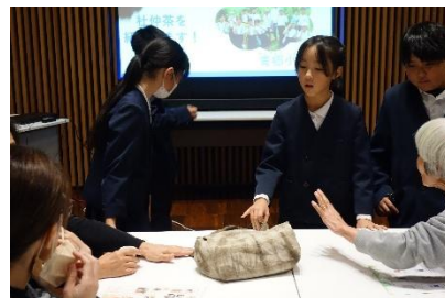
杜仲茶染めの作品も紹介です