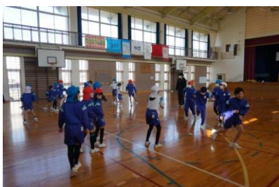
4年生 体育 「なわとび(大なわ)」