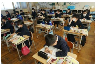
5年生 理科 「人のたんじょう」