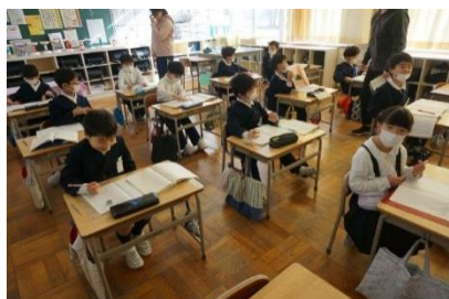
1年生 国語 「かたかなをかこう」