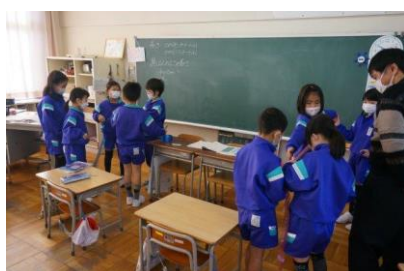
2年生 算数 「100cmをこえる長さ」