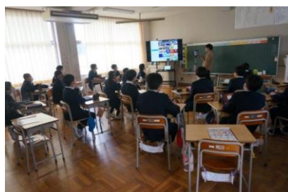
6年生 総合的な学習の時間 「和田のよいところ」