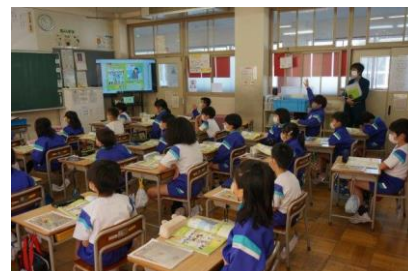
3年生 理科 「明かりをつけよう」